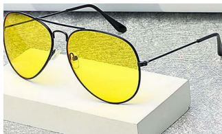
Voir la nuit comme en pleine journée ? C'est possible ! (Vision Nocturne)