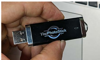
Piccolo Gadget per le Vostre Foto, L'Idea È Geniale (New Gadgets Daily)