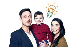
Offre électricité verte E.Leclerc : comment ça marche ? (Energies E.Leclerc)