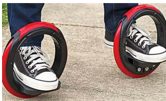
Ces moyens de transport qui vont révolutionner notre futur (Automoto, magazine auto et moto)