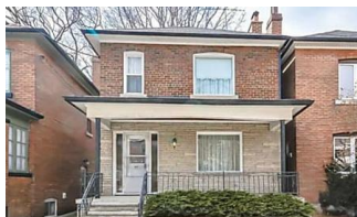
Cette femme de 96 ans vend sa maison, quand vous voyez l'intérieur, vous tombez des nues...