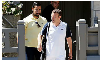
Les scandales politiques qui ont choqué les Français (Marie France)